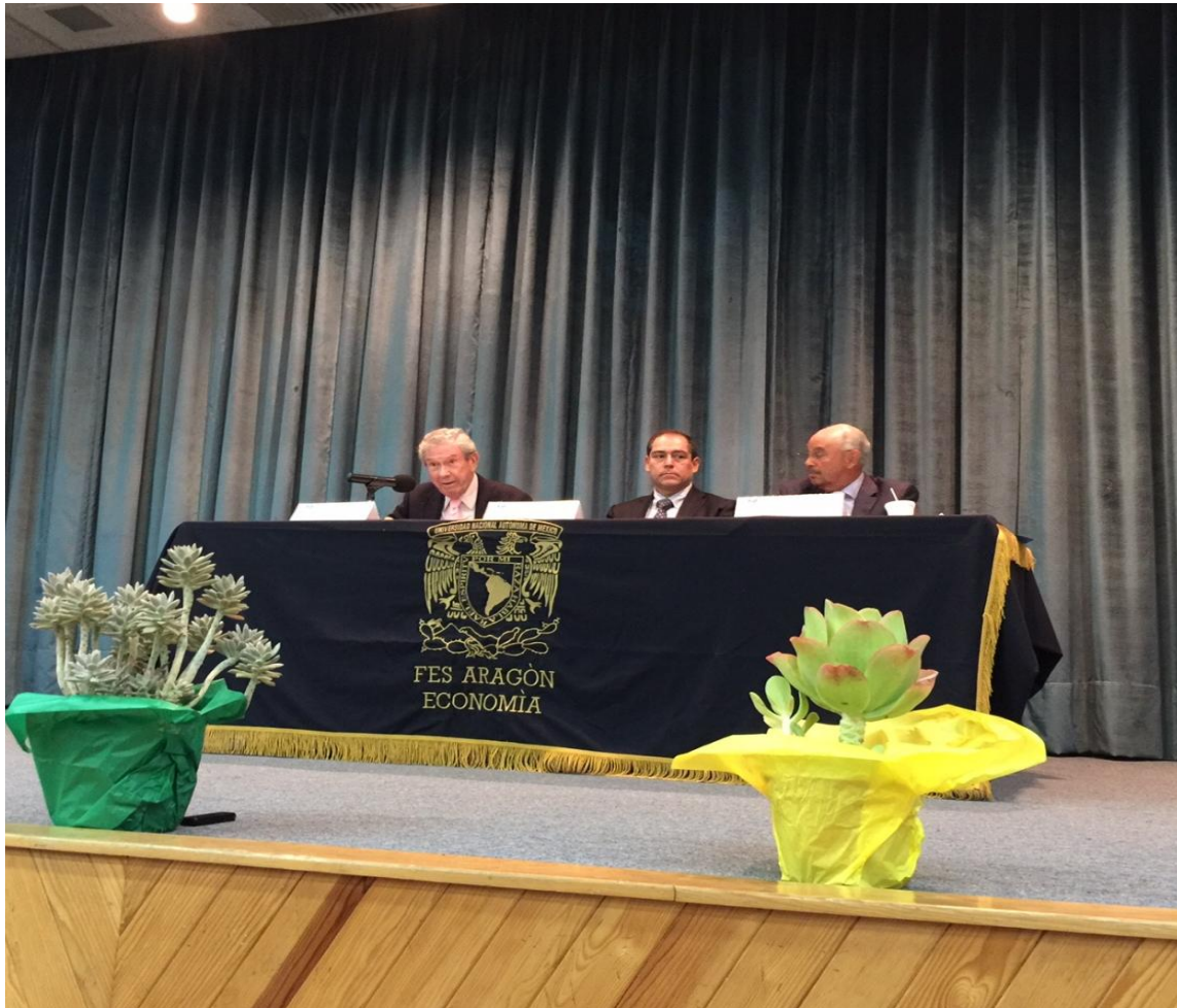
Ponencia Dr. Carlos Tello Macías