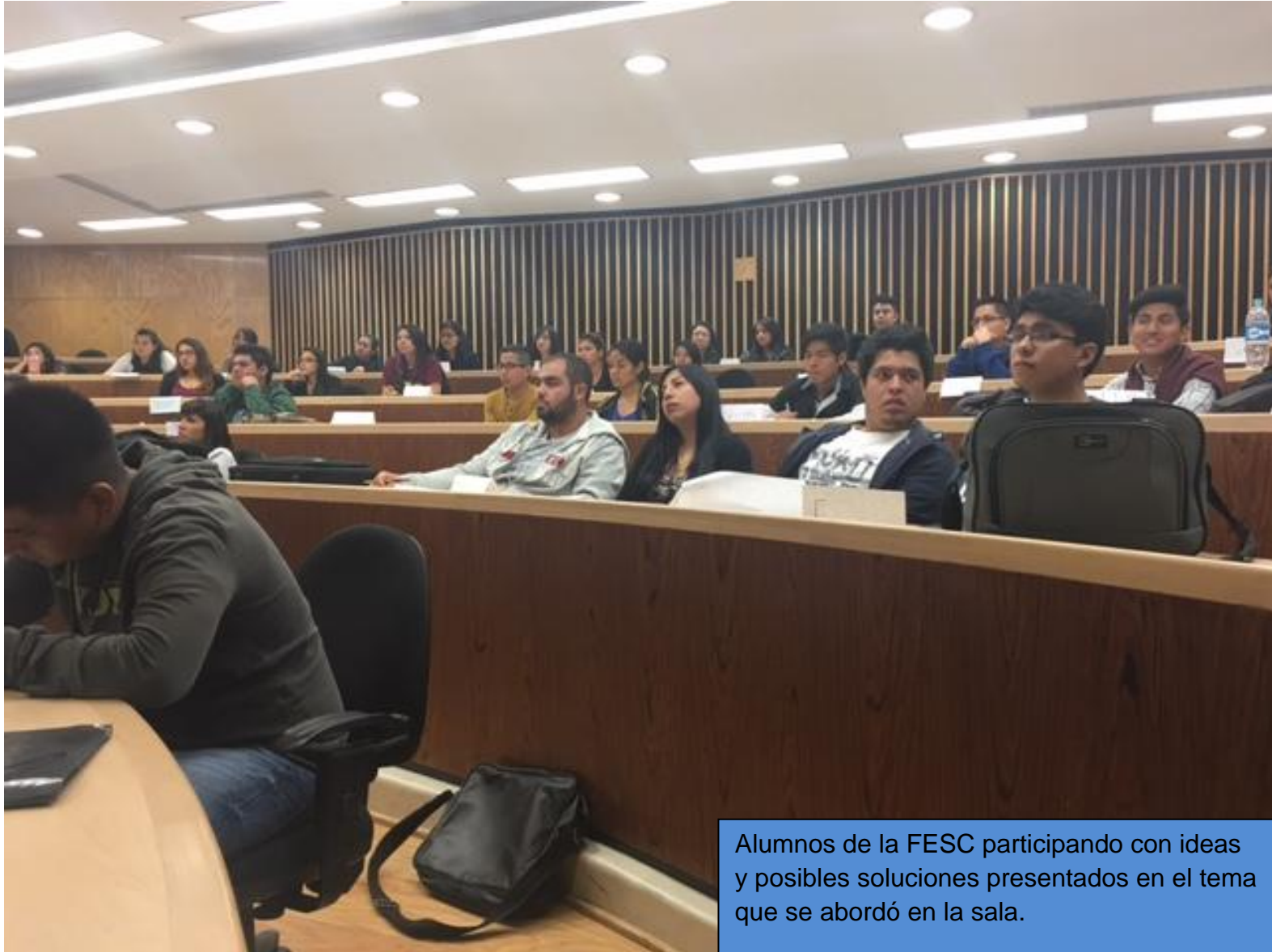
Alumnos de la FESC participando con ideas y posibles soluciones presentados en el tema que se abordó en la sala.