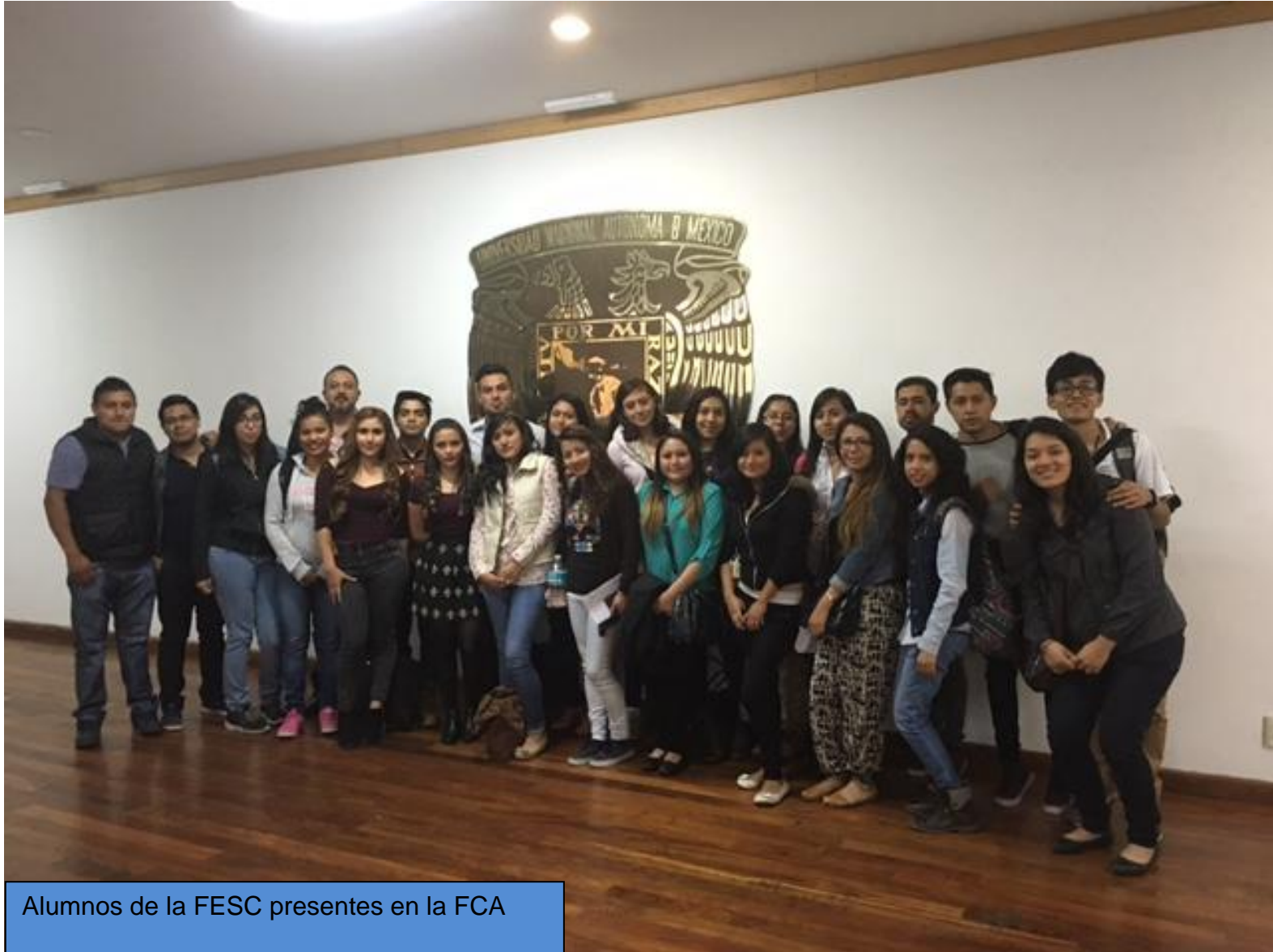
Alumnos de la FESC presentes en la FCA