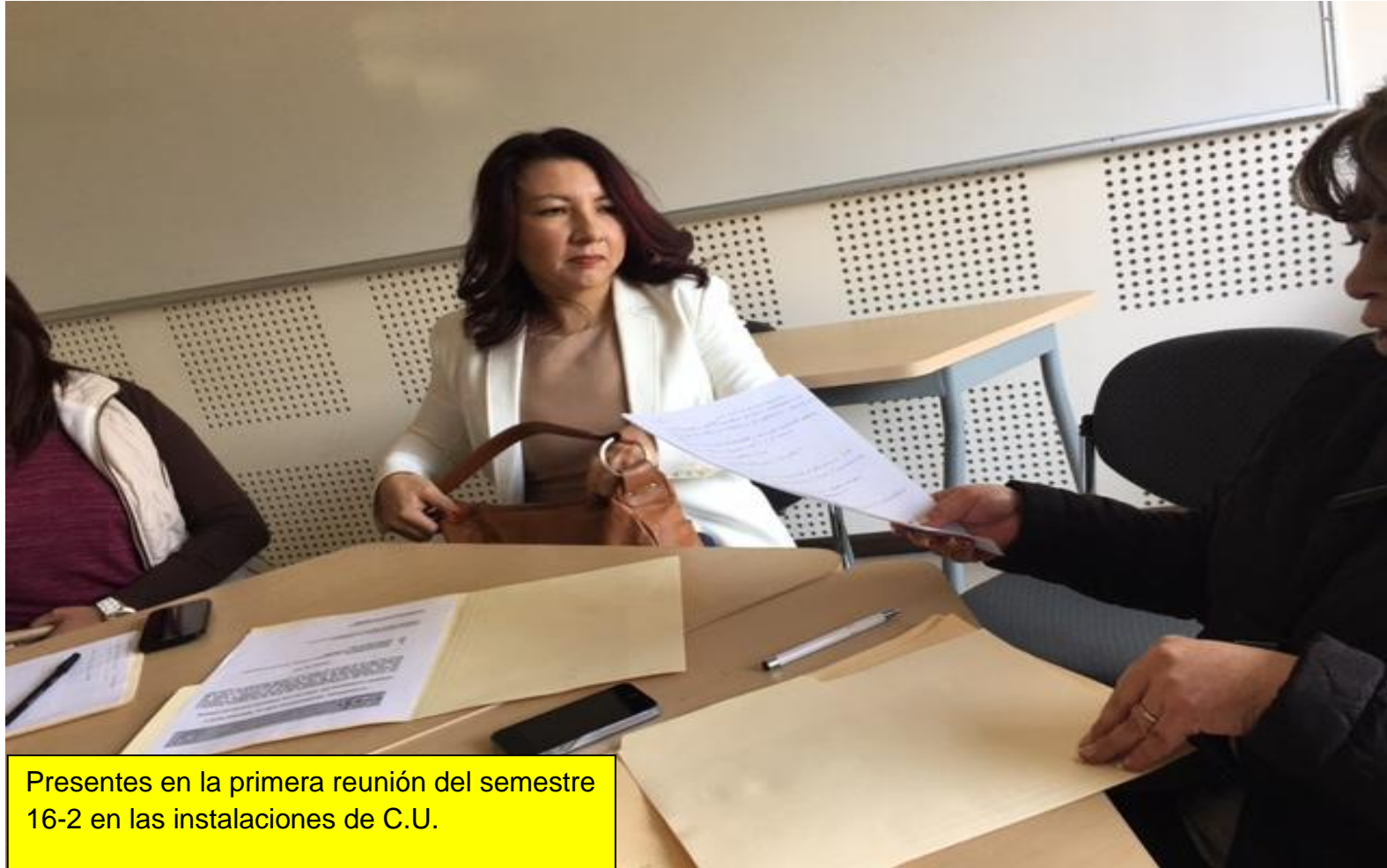
Presentes en la primera reunión del semestre 16-2 en las instalaciones de C.U.