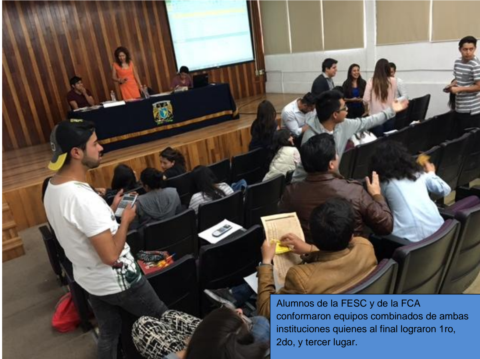
Alumnos de la FESC y de la FCA conformaron equipos combinados de ambas instituciones quienes al final lograron 1ro, 2do, y tercer lugar.