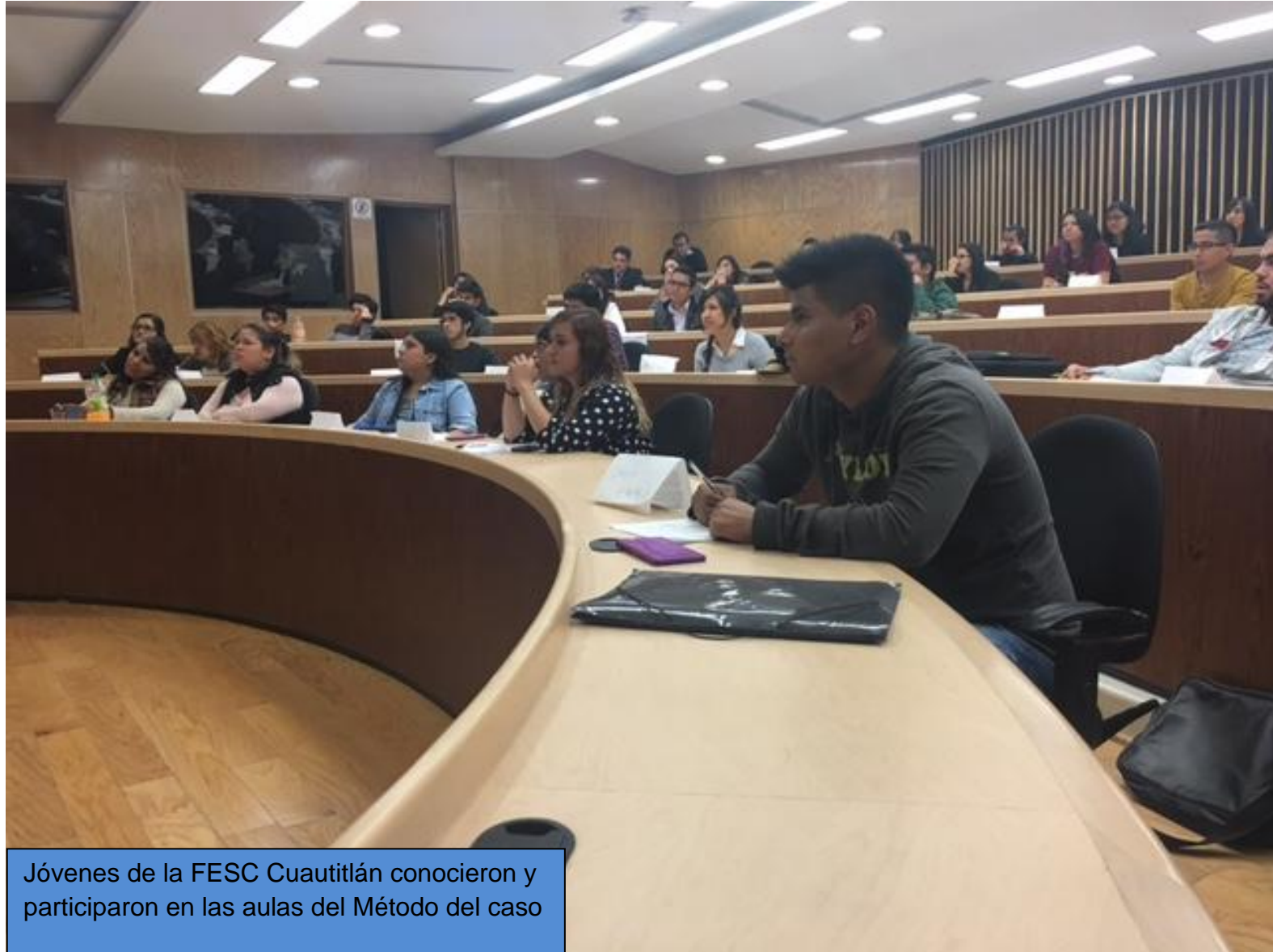
Jóvenes de la FESC Cuautitlán conocieron y participaron en las aulas del Método del caso