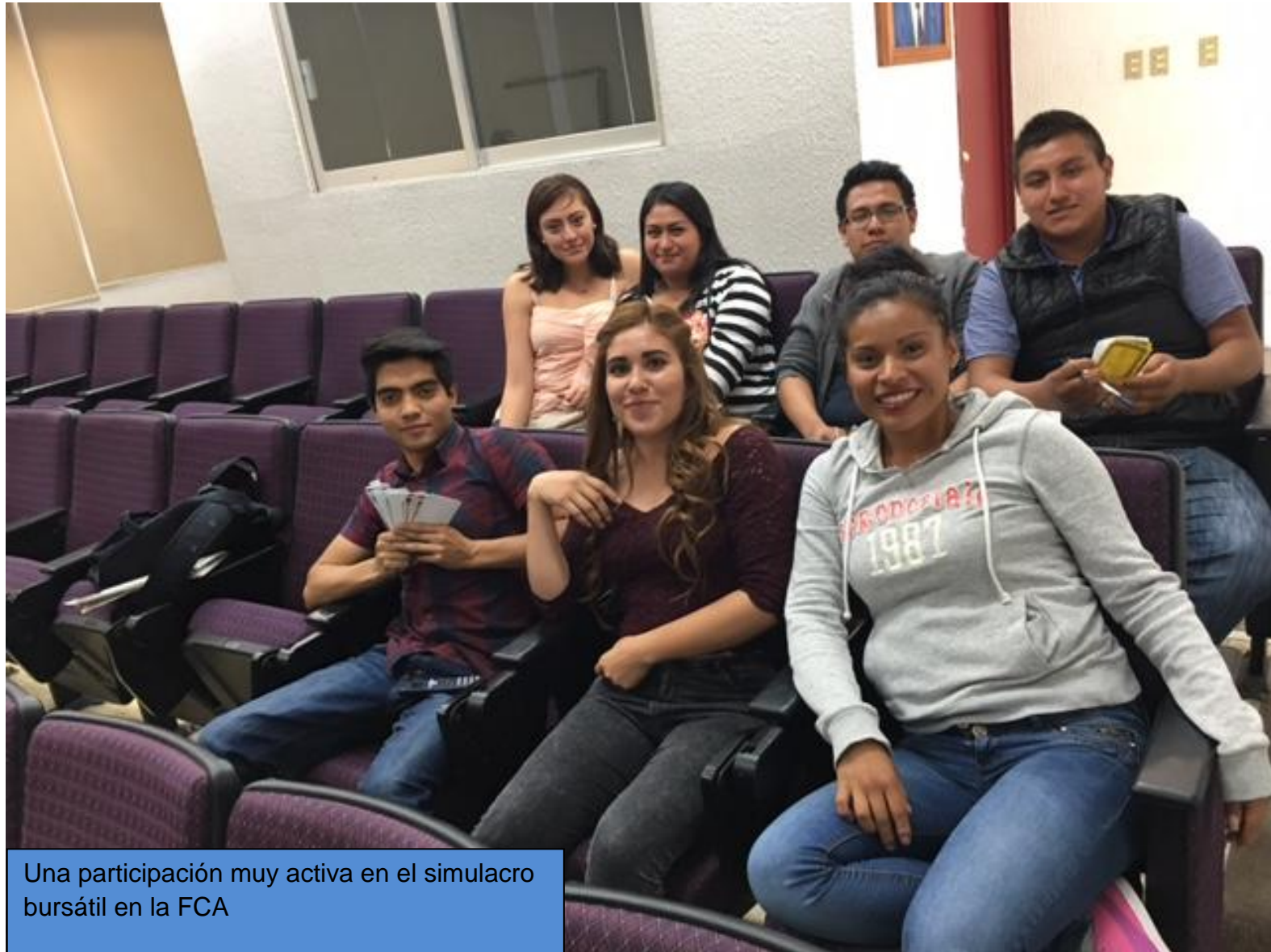
Una participación muy activa en el simulacro bursátil en la FCA